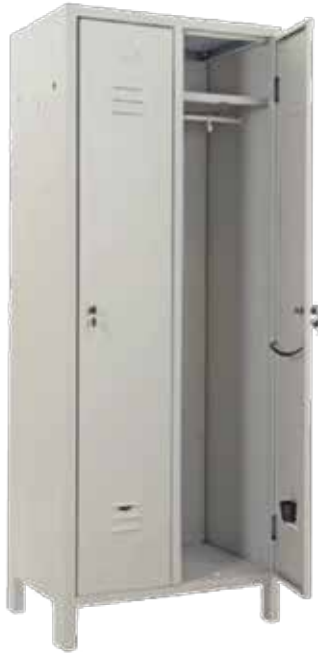
Spogliatoio 2 posti