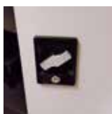
Maniglia a rotazione