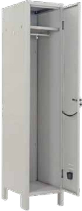
Spogliatoio 1 posto